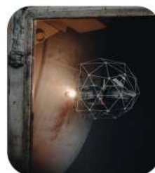
Inspecciones interiores con drones