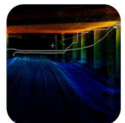
Modelo 3D e informes digitales